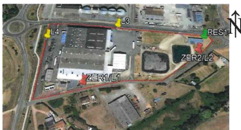
Figure 1. Emplacement des points de mesures